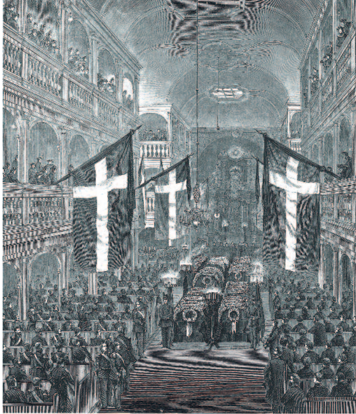
Sørgehøjtidelighed i Garnisonskirke på Sct. Annæ Plads i København den 27. april, hvor 11 officerer, en befalingsmand og to menige blev begravet. Kisterne var dækket med sort klæde, og der var sørgefior på fanerne. Træsnit i Illustreret Tidende.