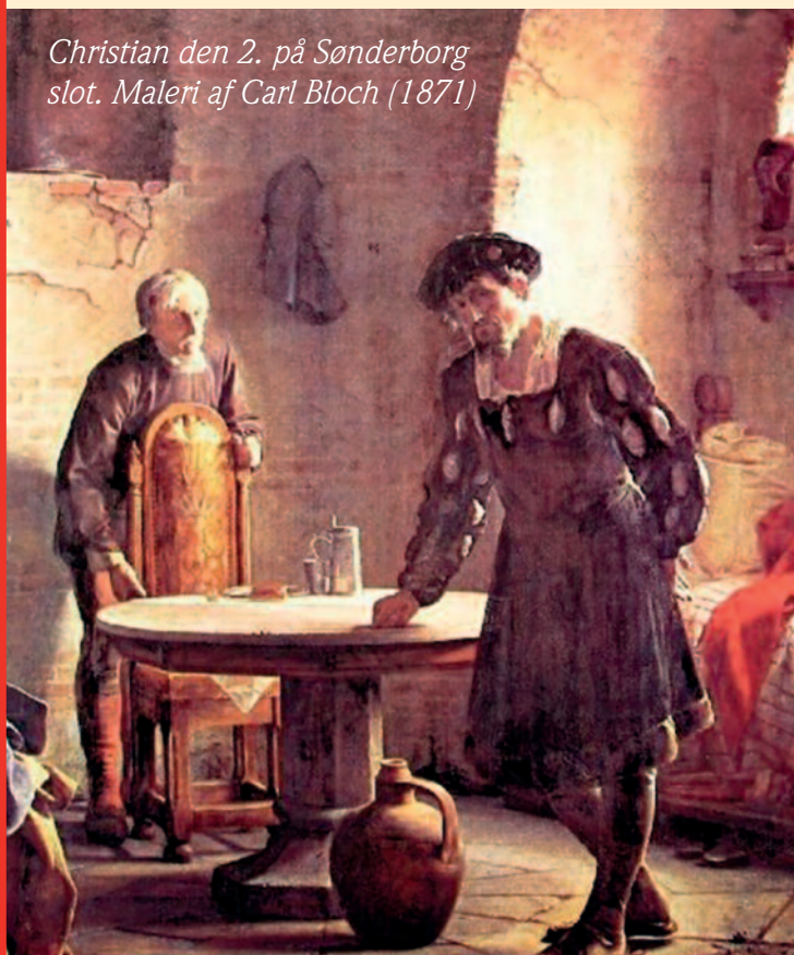
Christian den 2. på Sønderborg slot. Maleri af Carl Bloch (1871)

Oratoriet følger Christian II's og dronning Elisabeths skæbne i forholdet til Luther, kejseren og kong Christian III. Christian II und Christian III var fætre - begge var de brændende lutheranere - men politisk var de modstandere i kampen om den danske krone.