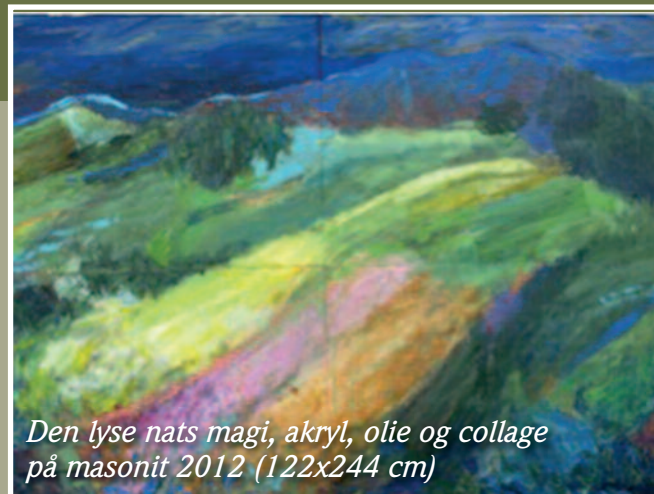
Den lyse nats magi, akryl, olie og collage på masonit 2012 (122x244 cm)