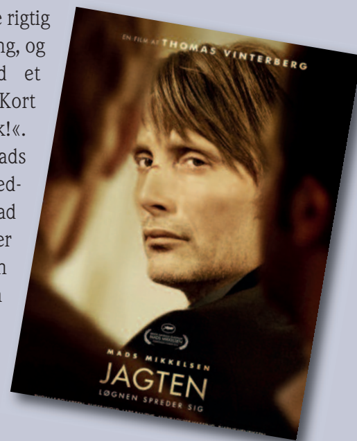
Billede: Nordisk Film