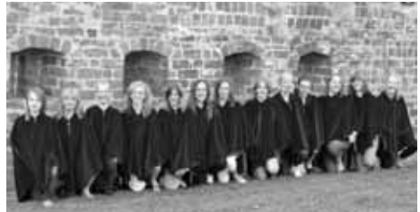
Løgumkloster kirkes ungdomschor