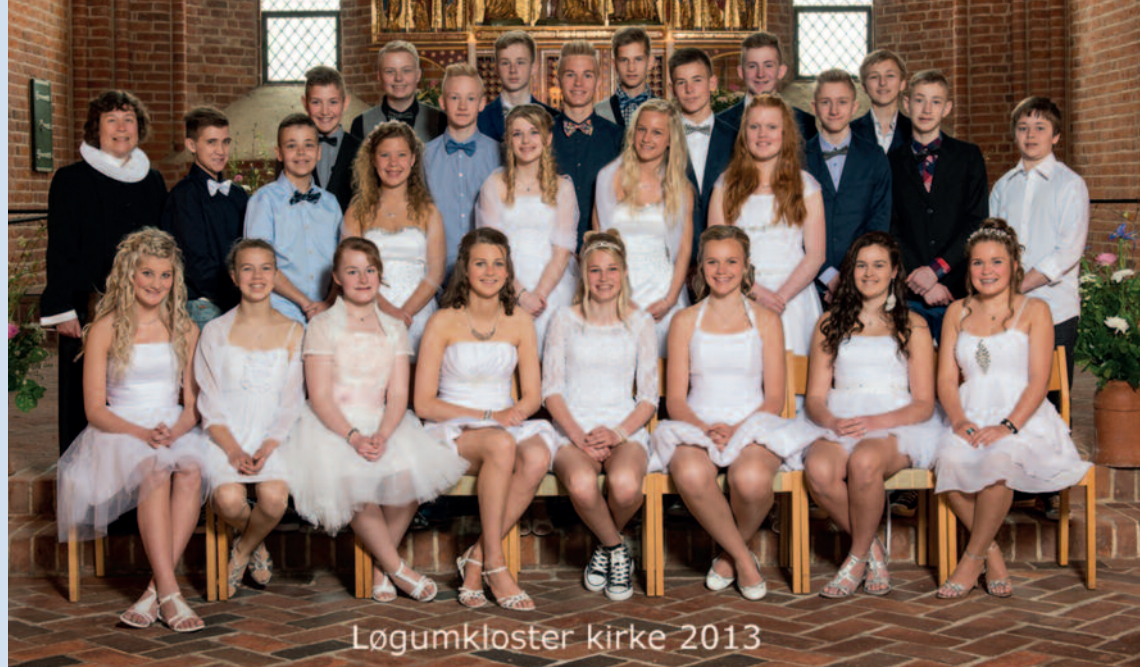
Løgumkloster kirke 2013