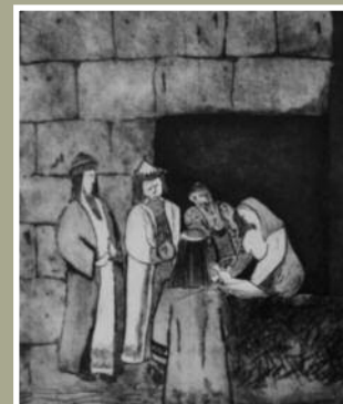
Inga Floutrup - »hun fødte sin søn«