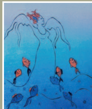
Ingsi Croon - »Englen«