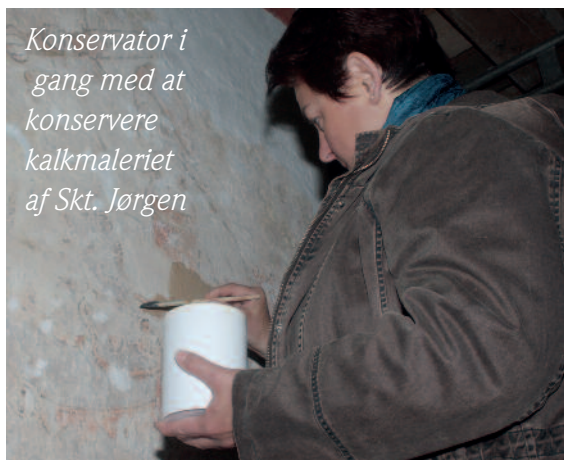
Konservator i gang med at konservere kalkmaleriet af Skt. Jørgen