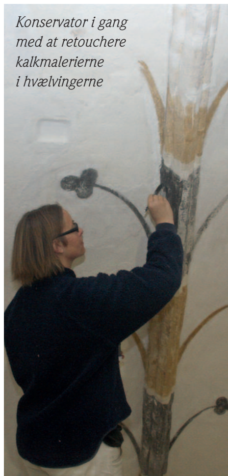
Konservator i gang med at retouchere kalkmalerierne i hvælvingerne