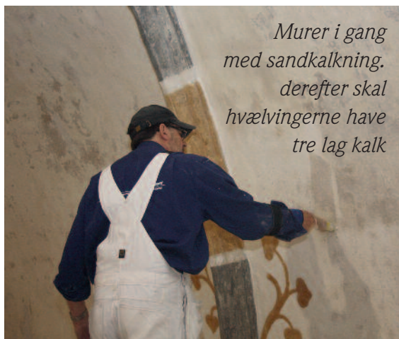
Murer i gang med sandkalkning. derefter skal hvælvingerne have tre lag kalk