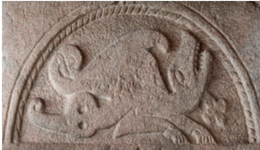
Eksempel på et Tympanon fra Tømmerby Kirke.

Projektet til indvendig istandsættelse af kirken blev endelig godkendt af Ribe Stiftsøvrighed d. 30. januar. I forbindelse med kirkens restaurering vil der blive installeret nyt lydanlæg bl.a. med en forbedret lyd kvalitet, og