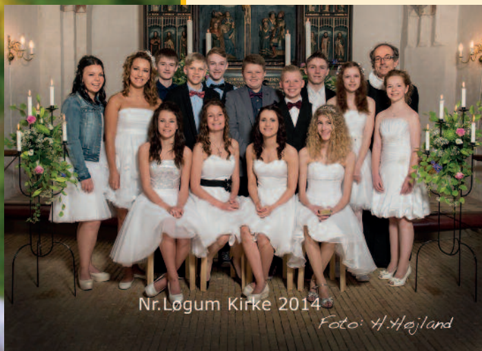
Nr.Løgum Kirke 2014