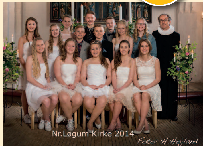
Nr.Løgum Kirke 2014